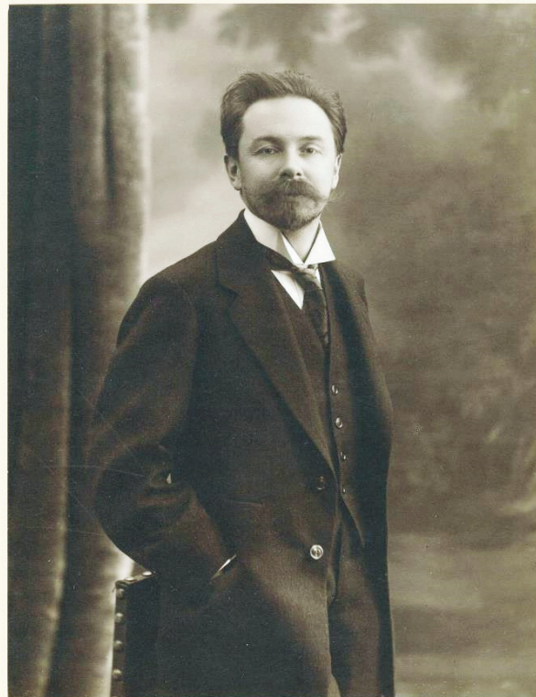
Este año marca el 150 aniversario del nacimiento del compositor simbolista y místico-romántico ruso, Alexander Scriabin.

Es en un encuentro de alumnos en 1891, ya en el Conservatorio de Moscú, cuando Sabaneyev escucha a Scriabin por